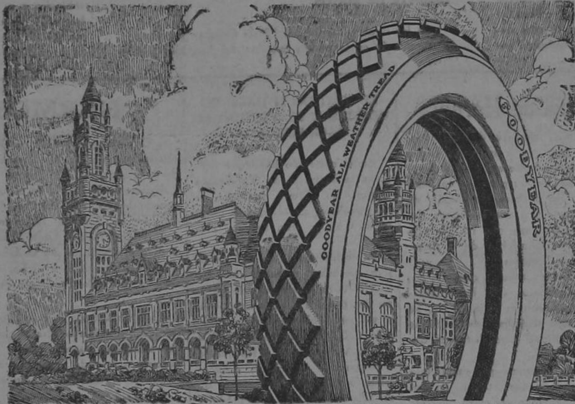
Hel Vroedes, Palais Le s'Gravenhage, Holland.

Las Gomas Neumáticas GOODYEAR "Sin Pestaña" economizan tiempo en todo el sentido de la palabra.