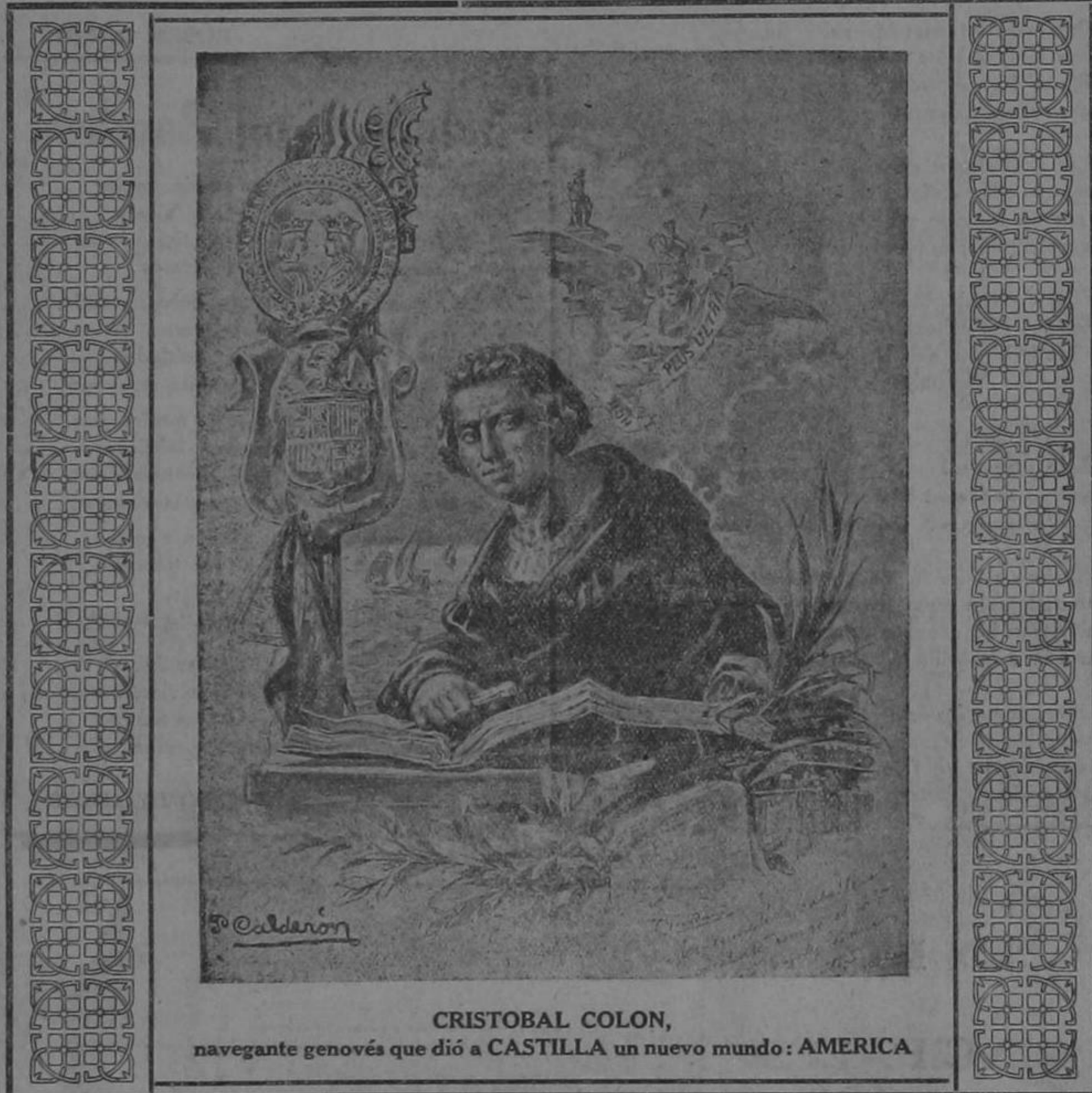
CRISTOBAL COLON, navegante genovés que dió a CASTILLA un nuevo mundo: AMERICA

Luchó contra la indiferencia y preocupaciones de su tiempo; hizo frente a la pobreza con estoica resignación, y su grandeza de alma triunfó de pequeñez improvisando una expedición hacia lo desconocido. Pensar en las inmensas soledades del Océano y en la pobreza de los medios para emprender un viaje que todos presentían lleno de peligros y dificultades era motivo para retraerse el más fuerte. Si a esto se agrega la oposición que casi siempre se hace a todo procedimiento nuevo, ya se comprenderá los obstáculos que tuvo que vencer Colón para llevar adelante su idea fecunda y trascendental de surcar el Atlántico por ruta desconocida. Los portugueses, no obstante su fama de expertos y atrevidos navegantes queriendo arrebatar a Colón la gloria de ac-