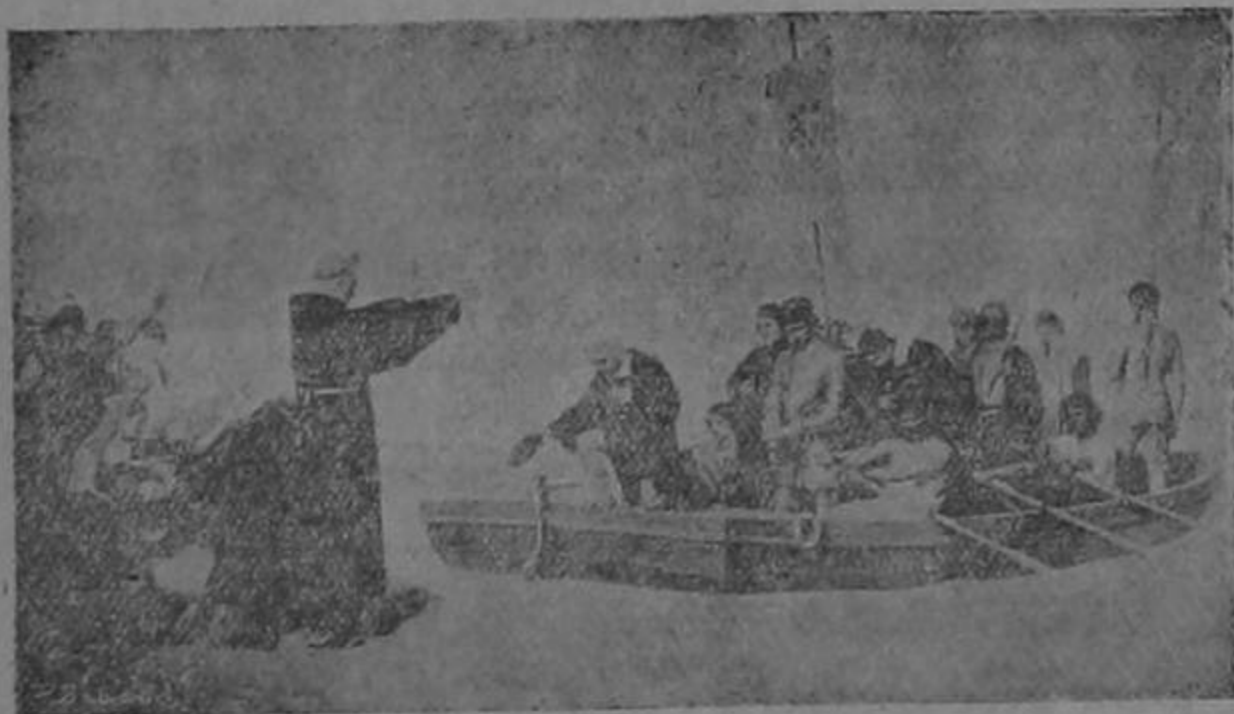
SALIDA DE PALOS EL 3 DE AGOSTO DE 1492

Hoy nuestro primer Coliseo luce sus más delicadas galas en esta fiesta patriótica y humanitaria, en la que damas costarricenses, nos muestran entusiasmadas el ardor de su sangre española.