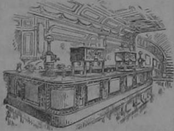
FLUGEL & CALPA LONDRES. N. 16