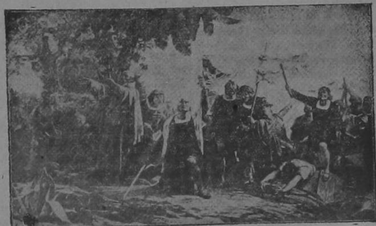
Desembarco de Colón el 12 de Agosto de 1492 en la isla Guanahani, en Las Lucayas, a la entrada del estrecho de la Florida, a la que puso por nombre San Salvador