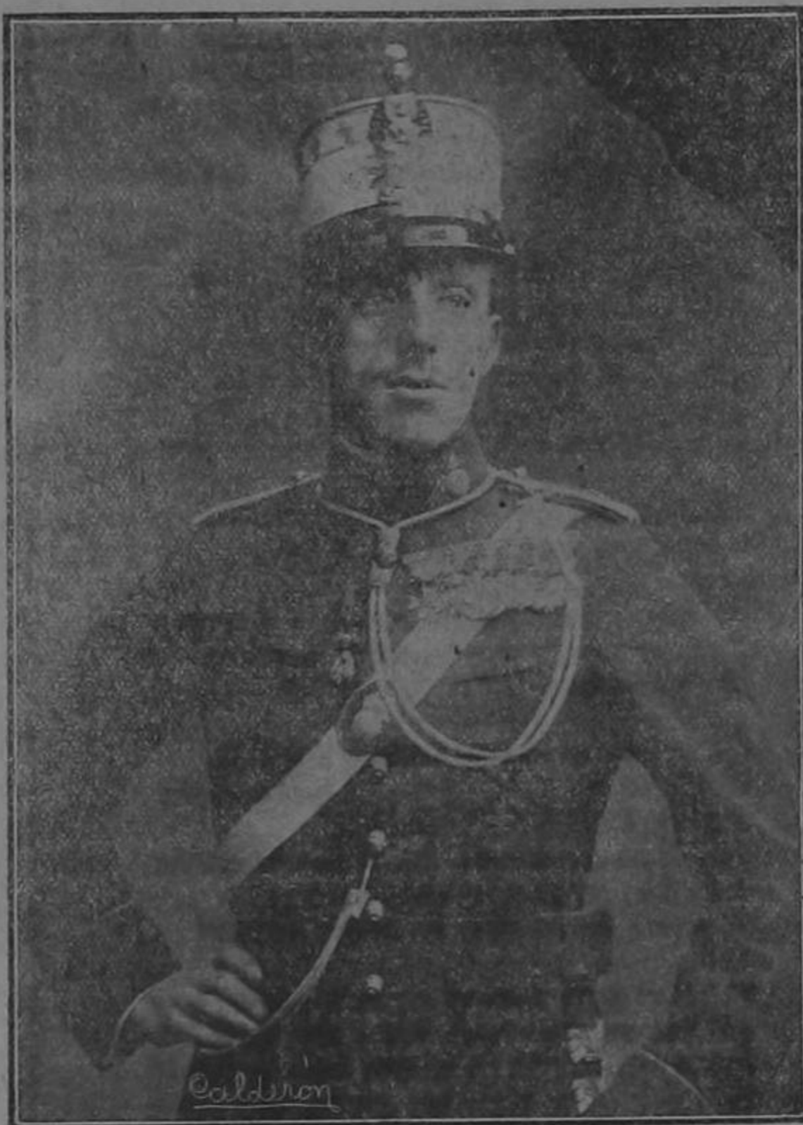
Don Alfonso XIII, Rey de España

Señor: sobre vuestras augustas sienes brilla una corona prestigiada por secular grandeza; el manto imperial de Carlos Quinto es la misma púrpura que desciende de vuestros hombros, y de vuestro cinto pende la espada del Cid y de Pelayo; sois el continuador de una casa grande, cuya historia, la historia de los Reyes de España,